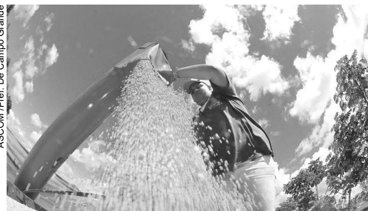
Colheita de soja e agronegócio

Política Monetária (Copom) do BC a tomar decisões sobre os juros básicos da economia, a Taxa Selic, definida atualmente em 14,75% ao ano. A Selic é o principal instrumento do BC para alcançar a meta de inflação.