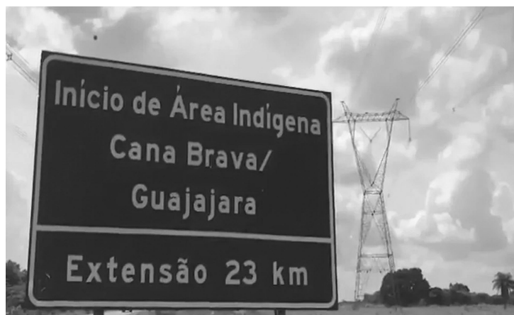
Área Indígena Canabrava/Guajajara tem 23 km de extensão

O foco da decisão é o trecho da rodovia que atravessa a Terra Indígena Canabrava/Guajajara