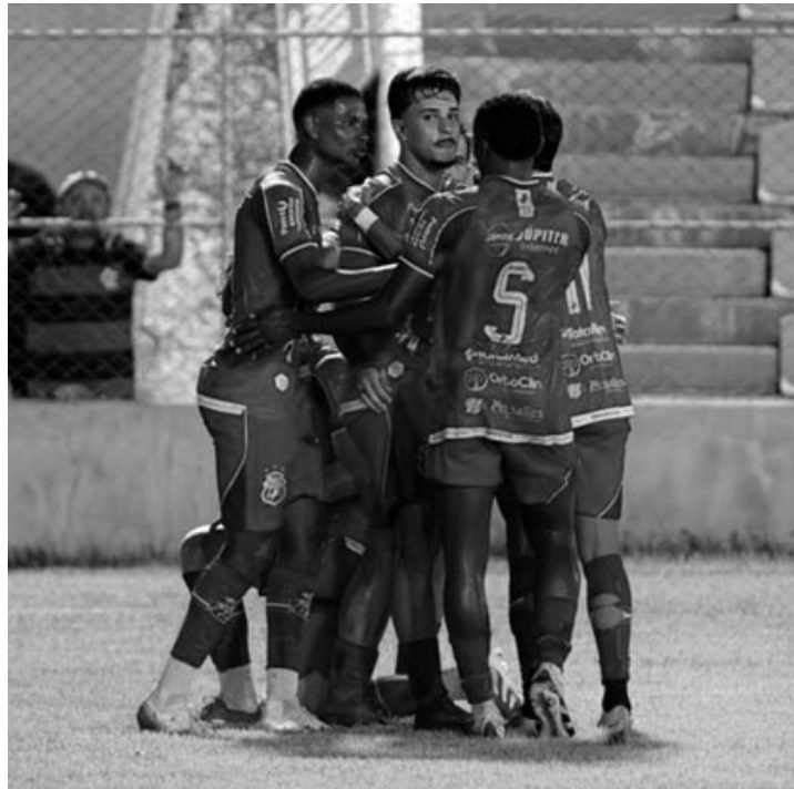
Cavalão de Aço muda o foco e treina pensando no Águia de Marabá

Time não tem tempo para descansar, hoje a tarde se reapresenta e inicia preparação para enfrentar o Águia de Marabá domingo (19), às 17h no Zinho de Oliveira