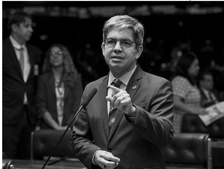
Randolfe Rodrigues (PT-AP), autor do projeto que virou lei

Tornou-se lei o direito à ajuda de custo para pacientes da rede pública que, em certas situações, necessitem de atendimento fora do município onde moram. A Lei 15.390, sancionada com um veto pelo presidente Lula e publicada no Diário Oficial da União (DOU) nesta quinta-feira (16), garante a continuidade de uma política que já existia no Sistema Único de Saúde (SUS), mas por meio de portarias. Do senador Randolfe Rodrigues (PT-AP), o projeto que deu origem à lei (PL 4.293/2025) foi aprovado no Senado no último dia 25 de março.