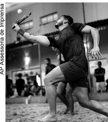
Beatchtenista em plena disputa da competição

O Campeonato Maranhense Oficial de Beach Tennis 2026 teve início com a realização do Duna Open, que foi disputado entre os dias 30 de janeiro e 1º de fevereiro, na Arena Premium do Golden Shopping, em São