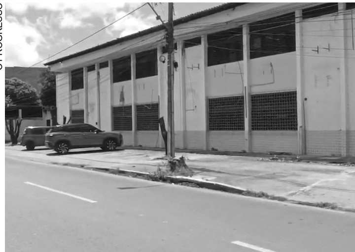
Antigo Fórum Ministro Henrique de La Rocque, antes arborizado, agora 'pelado'

Reconhecida no passado, gestão ambiental passa a ser questionada no presente