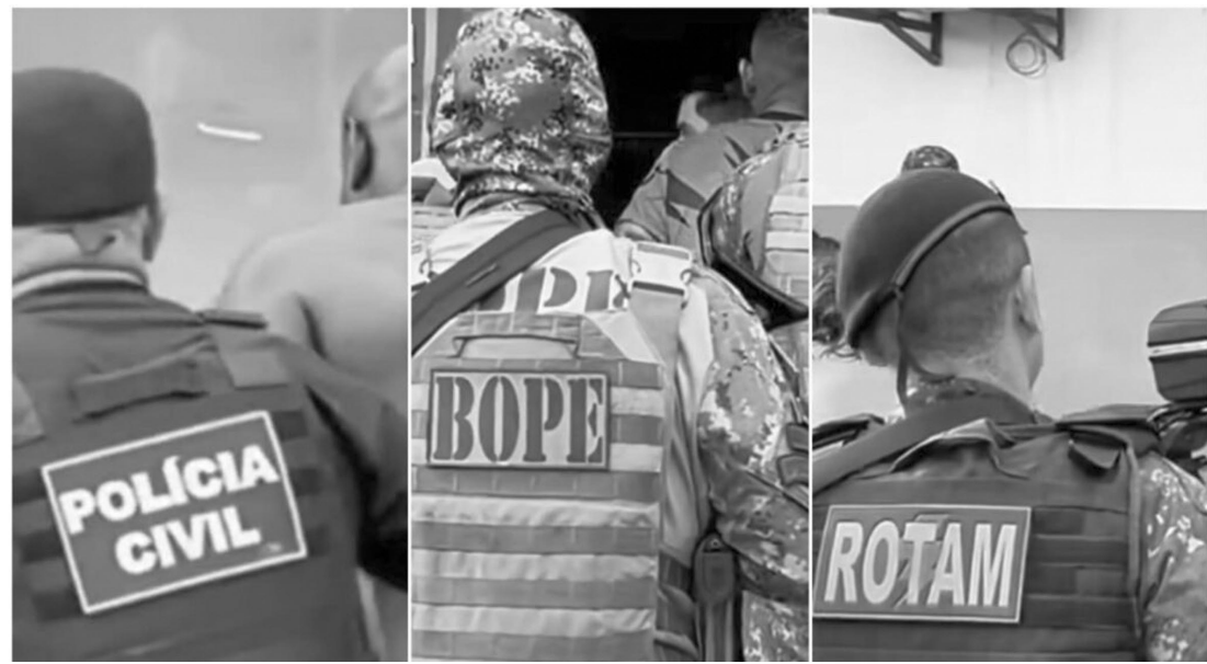
Forças especiais da Polícia Civil e Militar, cumpriram os mandados de prisão